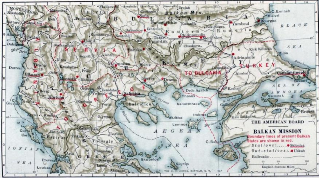
Ek-1 1914'te Amerikan Board'un Balkanlar'daki Misyun Merkezleri

http://www.dlir.org/images/stories/dlir/arit/map2.jpg (Erişim Tarihi: 14.01.2019).