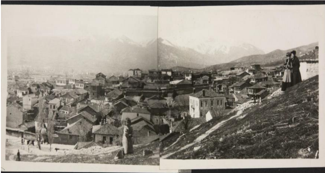
Ek-2 1913'te Manastır'ın Genel Görünümü

“A wide shot of the City of Monastir,” Digital Exhibits of the Archives and Special Collections , https://compass.fivecolleges.edu/object/mtholyoke:38701 , (Erişim Tarihi: 09.01.2019).