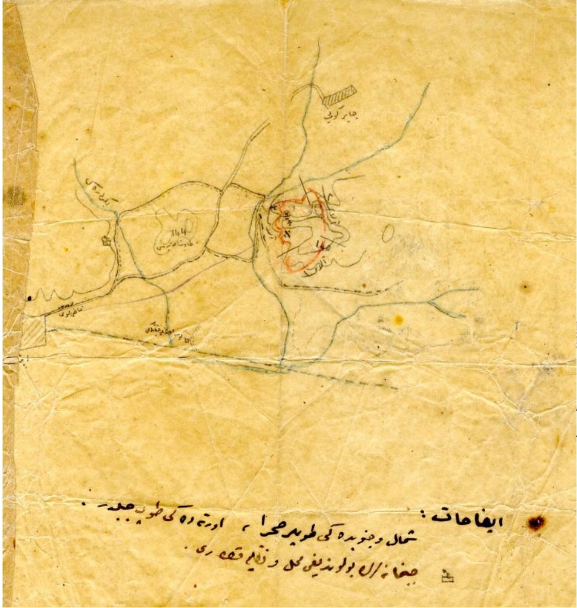
EK5: Bolu-Düzce İsyanı sırasında hazırlanan kroki