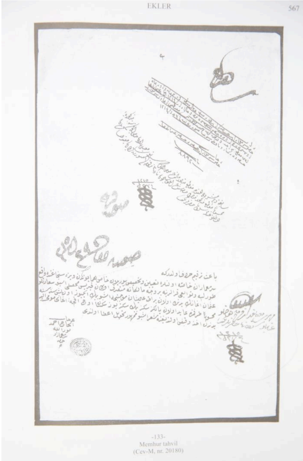
Ek 2: Mührü tatbik edilmiş bir tahvil (Kütükoğlu, Osmanlı Belgelerinin Dili, s.567)