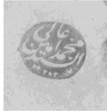
Ali Paşa'nın gerçek mührü (BOA, İrâde Meclis-i Mahsûs ( İ.MMS ), 132/5650)

İkinci hadise ise Sultan Abdülmecid'in kız kardeşi ile evli olan Damat Mehmed Ali Paşa'nın adının karıştığı Tatbik Mührü Hadisesi dir. Bu olay, sahte evrak düzenlemekten