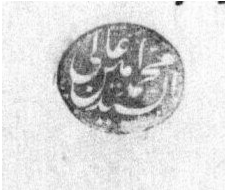
Ali Paşa adına kazdırılan sahte mühür (BOA, İ.MVL , 266/10140)