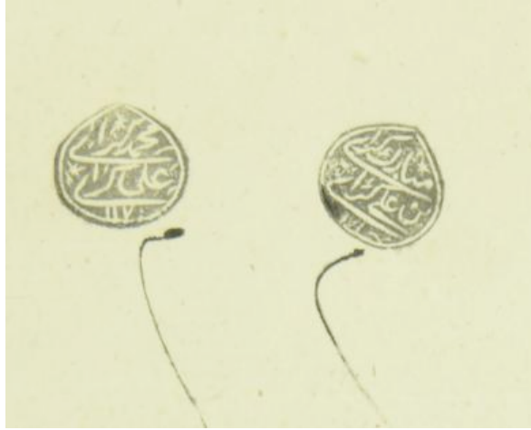
Ek 4: Mehmed ve Mübarek Girayların tatbik mühürleri (BOA, AE. SMST.III, 179/14117)