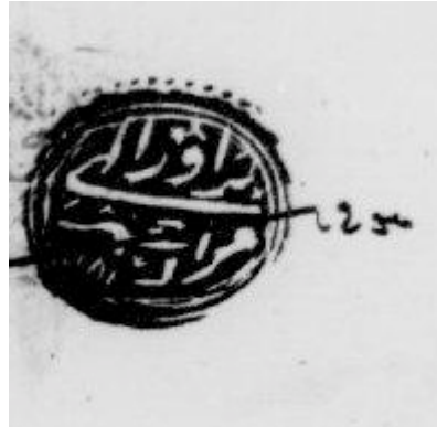
Müteveffâ şerhli mühür (BOA, D.M. MÜHRd, 37330/4)

3- Mühür sahibi vefat etmiş ise müteveffâ ya da kısaca mim harfi yazılırdı.