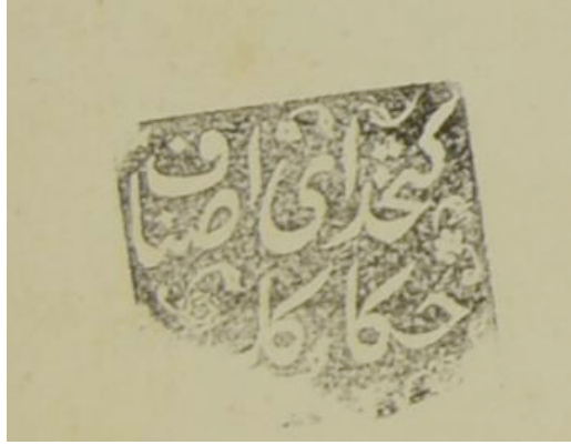
Ek 3: XIX. yüzyıl sonlarında Hakkâklar Kethüdası'nın kullandığı resmi mühür (BOA, ŞD, 2864/13)