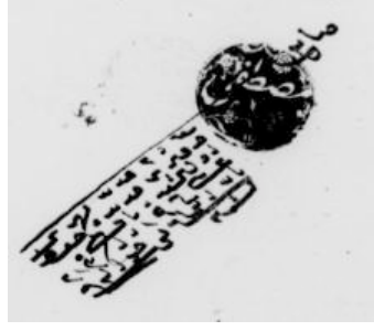
Zayi olmuş bir mühür (BOA, D.M. MÜHRd, 37330/4)

2- Görevini bırakanlar için el çekme, feragat etme manasında kasır-ı yed ,