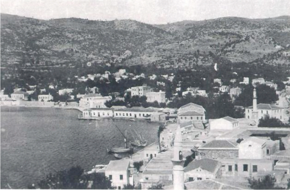
Resim 2. Adliye Camiinin genel görünüşü (1930'lar)