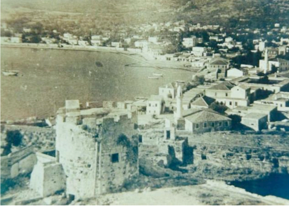
Resim 4. Kızılhisarlı Mustafa Paşa Camii Kitabesi.