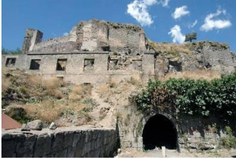
Resim-7: Bitlis Kalesi'nin gneyindeki tarihi yapılamanın mevcut durumundan bir kesit.