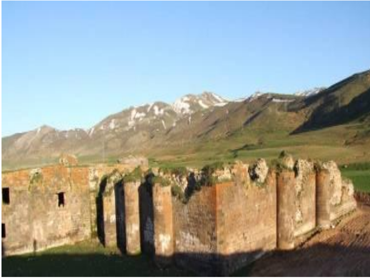
Resim-16: Anadolu'nun en byk hanı olarak bilinen Rahva (El-Aman) Han'ının (16.yy) ta ocađı olarak kullanılan yıkık duvarlarının onarım ncesi durumu (2005).