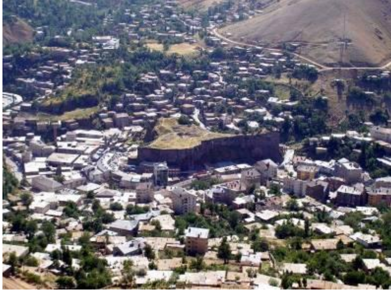
Resim-2: Bitlis'ten genel görünüm (2006).