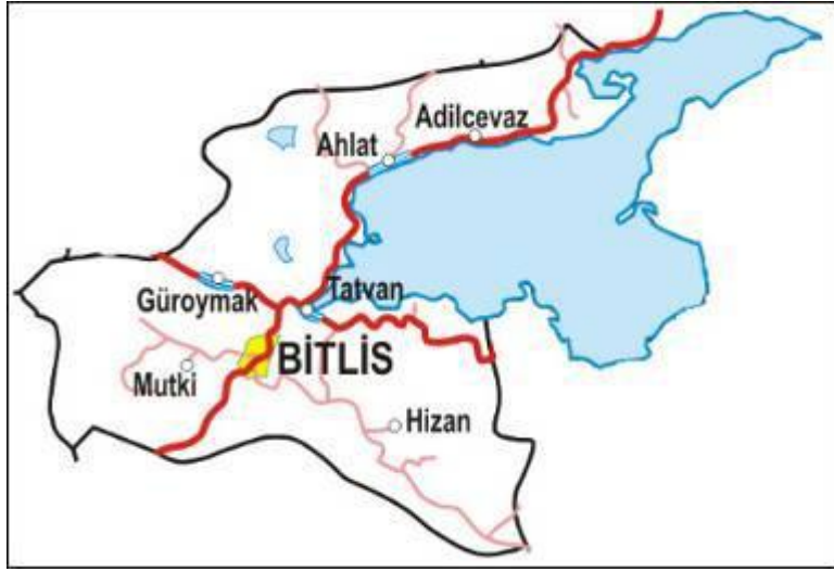
Resim-1: Bitlis il haritası. ( www.loadtr.com -22.3.2010)