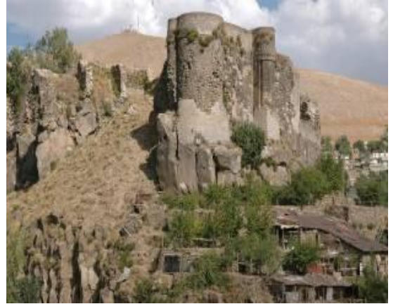
Resim-6:Bitlis Kalesi ve güneybatı surlarından detay. (2006)