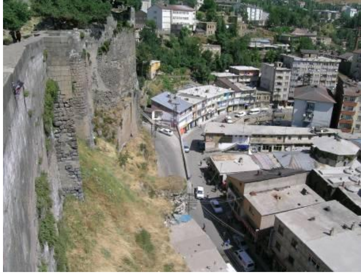
Resim-9: Bitlis Kalesinin kuzeyinde derenin üzerini kapatarak tarihi dokuyu zedeleyen yeni yapılaşmalar. (2005)