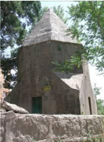
Resim-18: Gökmeşdan yapılar topluluğu içinde yer alan ve yeni bir yapının fon teşkil ettiği Şerefiye Türbesi'nin (M. 1394-1421) kuzey cepheden görünümü (2007).

kullanılan İhlasiye Medresesi (M.1589) (2007).