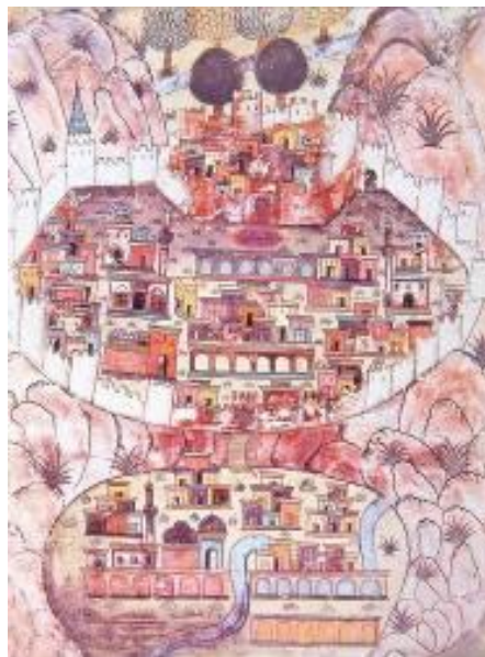
Resim-3: Matraki Nasuh'un Bitlis minyatr (İstanbul niversitesi Ktphanesi T5964, y 100a)