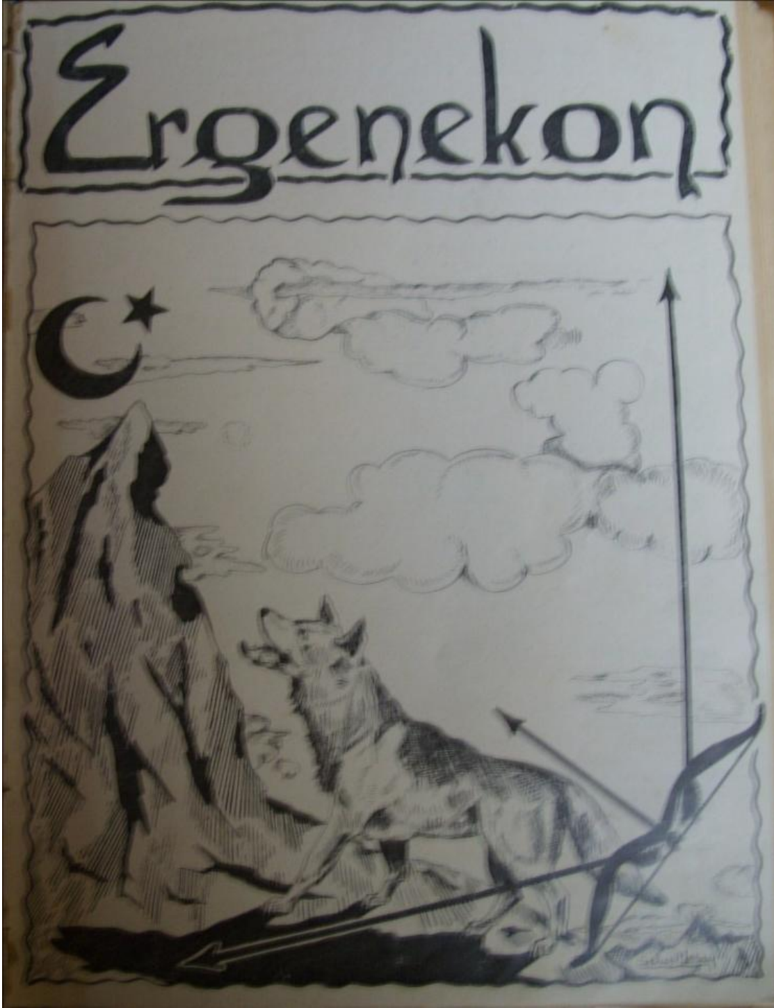
Ek 3: Ergenekon Dergisi 2. Sayı Dış Kapağı