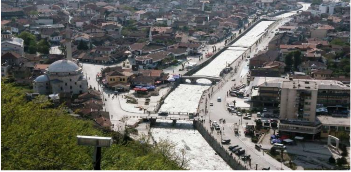
Fotoğraf 2: Prizren Kalesi'nden Sinan Paşa Camii ve Bistriça Nehri

Prizren Sancağı doğuda Tuna nehri, kuzeyde Sırbistan ve Bosna, batıda Karadağ ve İşkodra, güneyde Yanya ve Selanik Vilayetleri'yle sınırları olan takriben 19.900 kilometrekarelik bir mahalden ibaretti. 1 Şehir, Beli Drim'in bir kolu olan küçük Bistriça akarsuyunun Duvska Klisura boğazından ovaya açıldığı yerde verimli Metohiya ovasının güney kenarında bulunmaktadır. Prizren, Şar dağlarının kuzey yamaçları ile kısmen ova üzerinde kurulmuştur. Bursa ve Manisa gibi yamaçta kurulması bakımından diğer Osmanlı şehirlerine benzer. Nüfus bakımından Edirne ve Selanik'ten sonra Balkanların en büyük üçüncü şehri olan Prizren'in ismi bazı Osmanlı kaynaklarında ve kitabelerde değişik şekillerde kaydedildiği görülmektedir. 2 Bunlar arasında en yaygın kullanılanları: Prizdriyan, Prizdriyana, Prizrendi, Porzerin, Perserin, Prizrin, Prezrin, Perserin Pürzeyn, Perzerrin, Prisren, Pürzen, Zerrin, Prisrend, Prisrendi, Perzerin'dir. Tüm bu adların anlamında " altından yapılmış, altın gibi parlak ve zenginlik dolu şehir " anlamının çıktığını vurgulamak gerekir. 3