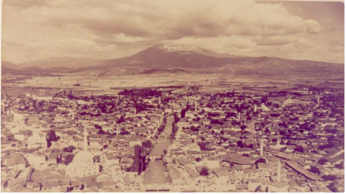
Fotoğraf 1: Koritnik Dağı ve Bistrica Nehri

Prizren, XVII. yüzyılın son çeyreğindeki Osmanlı-Avusturya Savaşları sırasında büyük bir sarsıntı ve yıkım yaşamıştır. Şehir, bu sarsıntıdan ancak XVIII. yüzyılın ikinci yarısının sonlarında kurtulmuş ve XIX. yüzyılda eski ihtişamına kavuşmuştur. Bu dönemde ticaret ve zanaat bir hayli gelişmiştir. Ancak Berlin Kongresi sonrasında başlayan huzursuzluk Balkan Savaşları'na kadar devam etmiştir. Arnavutlar kendi iskân bölgelerinin Sırbistan, Yunanistan ve Karadağ'a verilmesini kabul etmeyerek Prizren'de İttihat Cemiyeti'ni kurmuşlardır. Cemiyet, kuruluş amacından saparak daha sonra Arnavut ulusçuluğunun lokomotifi haline gelerek Arnavutlar arasında güç kazanmıştır. Hâlbuki başlangıçta cemiyetin ulusçu bir hareket noktasından yola çıkmadığı aksine Osmanlı Devleti'nden ayrılmak gibi bir niyetle kurulmadığı bilinmektedir. İngiltere, Rusya, Avusturya-Macaristan ve İtalya gibi büyük devletler, bu dönemde olayları yakından takip etmek için Prizren'de konsolosluklar açmışlardır. Neticede Prizren İttihat Cemiyeti'nin, 1913'te kurulacak olan Arnavut Devleti'nin çekirdeğini oluşturmuştur. Zaten Balkan Savaşları sonunda 31 Ekim 1912'de de şehir Sırp kontrolüne geçmiş ve Prizren'deki Osmanlı idaresi de sona ermiştir.