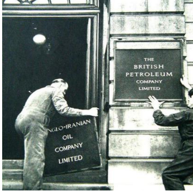
Fotoğraf 2: Şirket adının British Petroleum olarak değiştirilmesi

çıkarılan petrolün işlenmesi ve uluslararası piyasalara satılması İran Milli Petrol Şirketi adına konsorsiyum tarafından yapılacaktı. Bununla birlikte belirlenen petrol alanlarının dışındaki alanlar (ki bu da ülkede ki toplam petrol alanlarının üçte ikisine denk gelmekteydi) İran Milli Petrol Şirketi'nin tasarrufuna bırakıldı. Tespit edilen petrol alanlarından elde edilecek petrol gelirleri İran hükümet ve Konsorsiyum arasında yüzde 50-50 olarak paylaşılacaktı 80 .