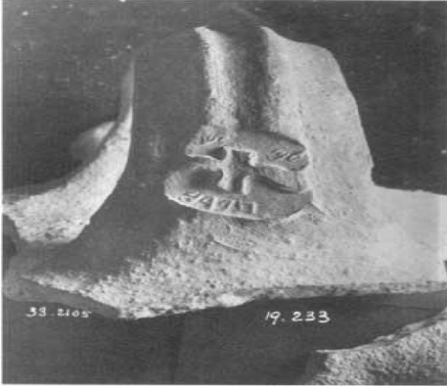
“LMLK” mühürlü küpler.

J. C. H. Laughlin, Approaching The Ancient World-Archaeology and the Bible , Routledge, London and Newyork, 2002., s.146.