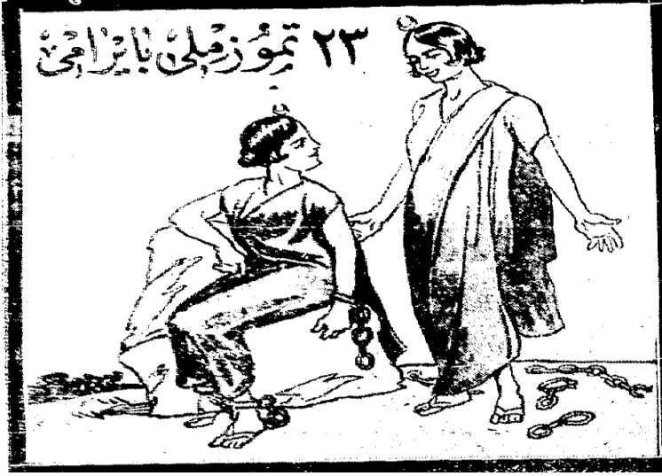
Resim 2- Cumhuriyet , 24 Temmuz 1925, No: 432

Resim 2 incelendiğinde, “23 Temmuz Milli Bayramı” ibaresi yer alan çerçevede, ellerinde ve ayaklarında zincir olan Türk milletini sembolize eden iki kadın görülmektedir. Bunlardan sadece ellerindeki zinciri kırabilen fakat ayakları bağlı kadın Meşrutiyeti, ellerindeki ve ayaklarındaki zincirleri kırarak tam hürriyete kavuşmuş kadın da Cumhuriyet inkılabını sembolize etmektedir. Bu iki kadının başlarındaki hilalli taç de İslam kimliğini