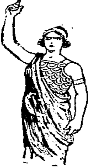
Resim 12- Cumhuriyet , 23 Temmuz 1935, No:4018

Resim 11’de, elindeki meşale ile milleti aydınlatmaya geleceğe daha hür bakmaya yönelten Meşrutiyet sembolize edilmiştir.