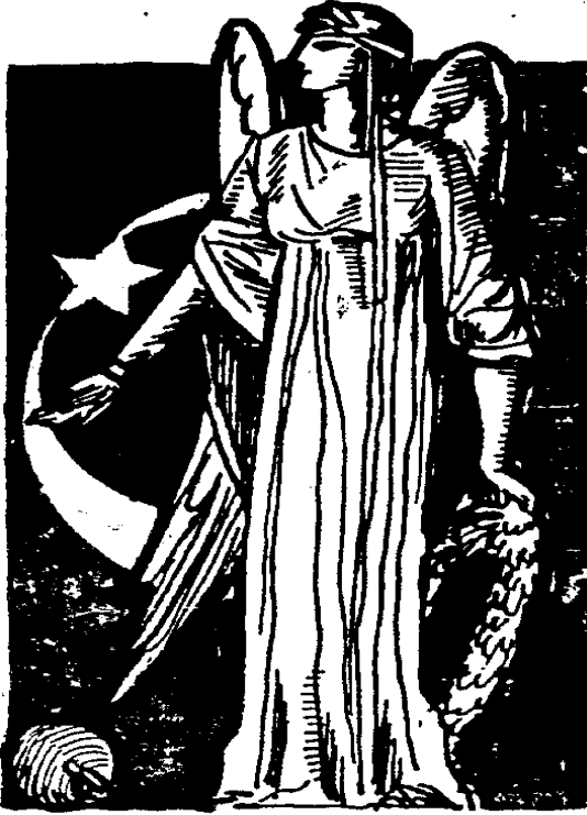
Resim 7- Vakit , 23 Temmuz 1930, No: 4503

milletine uyarladığımızda ise meşrutiyeti sembolize eden kadının elindeki meşale ile aydınlığı, yanında bulunan metin ve divitle Kanunu Esasi'yi sembolize ettiğini söyleyebiliriz. Bunlar da Meşrutiyetle elde edilen kazanımlardan hürriyet ve adaletin Türk milletinin geleceğine bir meşale vazifesi gördüğü söylenebilir.