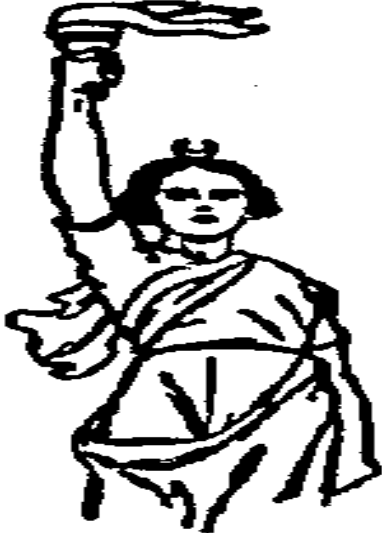
Resim 11- Cumhuriyet , 23 Temmuz 1934, No: 3668.

Vakit gazetesinin 23 Temmuz 1933 tarihli nüshasında yer alan bu resimde de, Türk milletinin 10-23 Temmuzda esaretten hürriyete kavuşması sembolize edilmiştir