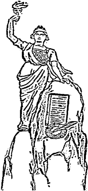
Resim 6- Cumhuriyet , 23 Temmuz 1930, NO:2230

Resim 5'te de arka fonda Meşrutiyetin bir güneş gibi doğması, milletin zincirlerini kırarak hürriyetine kavuşması sembolleştirilmiştir.