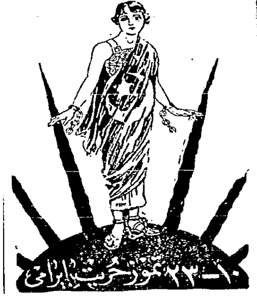
Resim 4- Cumhuriyet , 23 Temmuz 1928, NO:1510

Resim 4'te ise yine alt fonda "10-23 Temmuz Hürriyet Bayramı" ibaresi yer almakta, güneşle birlikte doğan Türk milletini temsil eden bir kadın resmedilmiştir. Bu kadının da ellerindeki zincirin kırık, ayaklarındakilerin ise hala bağlı olduğu görülmektedir. Buradan şu mesaj verilmektedir: Meşrutiyet Türk milletine kısmi hürriyet vermiştir.