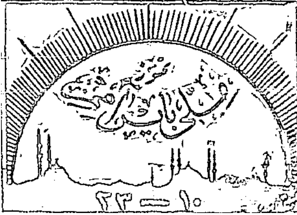
Resim 1- Cumhuriyet , 23 Temmuz 1924, No: 75

Cumhuriyet döneminde çıkan bazı gazetelerde, 23 Temmuz Hürriyet Bayramı günleri günün anlamına uygun resim ve karikatürlerle görselleştirilmiştir. Bu resimler ve yüklenilen anlamları şu şekilde özetleyebiliriz: