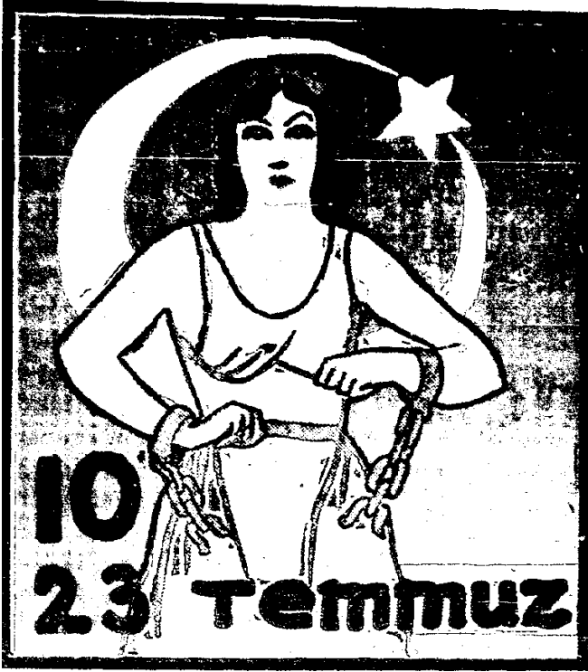
Resim 10- Vakit , 23 Temmuz 1933, No:5580

Vakit gazetesinin 23 Temmuz 1933 tarihli nüshasında yer alan bu resimde de, Türk milletinin 10-23 Temmuzda esaretten hürriyete kavuşması sembolize edilmiştir