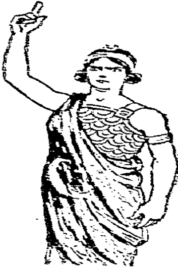
Resim 9- Cumhuriyet , 23 Temmuz 1933, No: 3308

Resim 8’de ise bu defa, Türklük ve İslam’ın sembolü olan ay-yıldız içerisinde zincirlerini kırmayı başaran kuvvetli yetişkin bir erkek figürüyle Meşrutiyet sembolize edilmiştir.