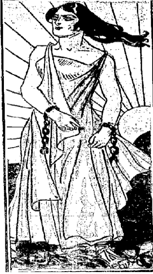
Resim 5- Vakit , 23 Temmuz 1928, NO:3786

Resim 5'te de arka fonda Meşrutiyetin bir güneş gibi doğması, milletin zincirlerini kırarak hürriyetine kavuşması sembolleştirilmiştir.