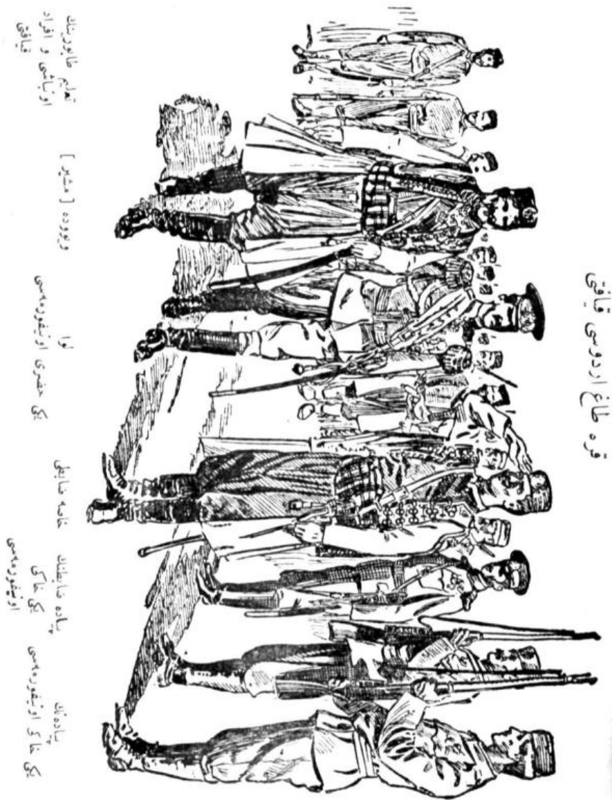
RESİM II: Karadağ Ordusunun Kıyafeti